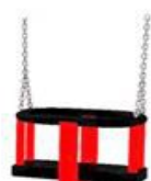
siedzisko typu kubetek