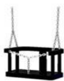
siedzisko z oparciem