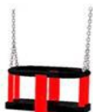
siedzisko typu kubetek