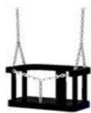
siedzisko z oparciem