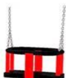
siedzisko typu kubetek